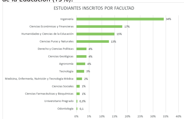
Figura 4 Distribución por Facultad de Inscritos en Campus UMSA-Coursera

Se contaron con participantes de las 13 facultades siendo la Facultad de Ingeniería con el mayor número de inscritos (34%), seguida por la Facultad de Ciencias Económicas y Financieras (17%) y por la Facultad Humanidades y Ciencias de la Educación (15%).