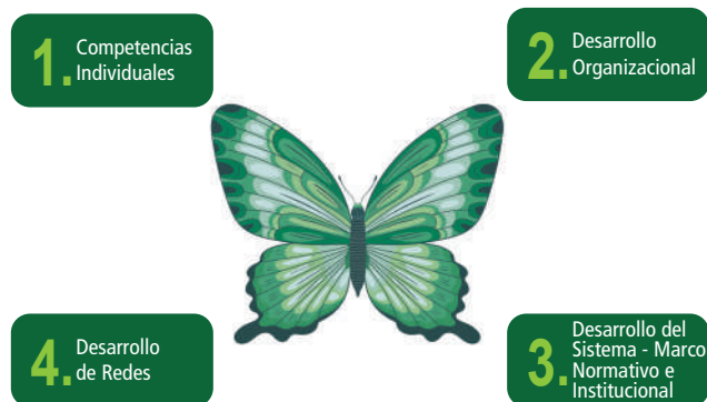
Figura 1: Modelo de Desarrollo de Capacidades y Competencias: "Modelo Mariposa"

La Agenda de Implementación del Programa de Fortalecimiento de Capacidades y Competencias 2021-2022 de la UMSA, consideró el "Modelo Mariposa", el cual como se aprecia en la Figura 1, se basa en cuatro dimensiones interrelacionadas e interdependientes: competencias individuales, desarrollo organizacional, fortalecimiento de redes de colaboración y desarrollo del sistema normativo e institucional.